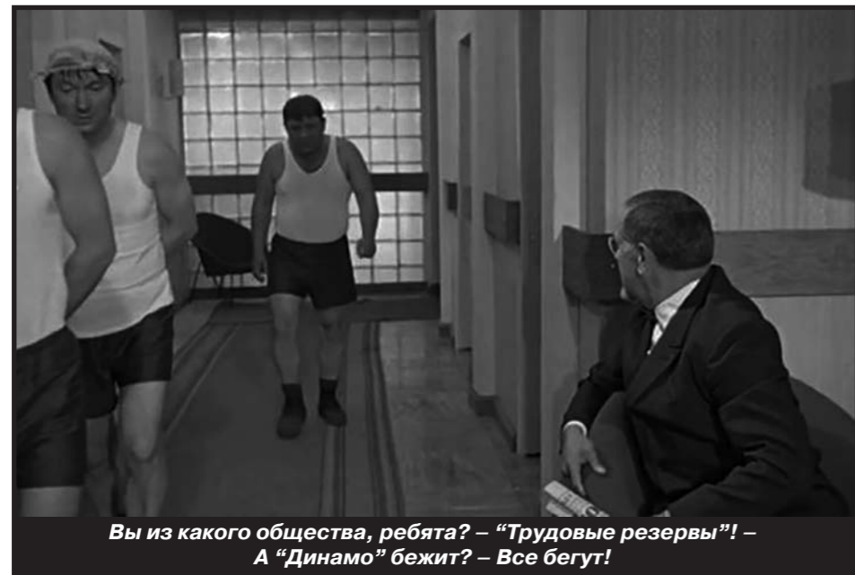
Вы из какого общества, ребята? – “Трудовые резервы”! – А “Динамо” бежит? – Все бегут!

Помните, как вся страна «в едином порыве» переизбирала «дедушку Ельцина»? Предвыборные алкотурсы по стране в окружении артистов? Слоган «голосуй, а то проиграешь»? А потом – новогодний мухомуж? Для тех, кто позабыл – запустили в производство ремейк. Не забавы ради запустили, время пришло, – старое юрлицо, которое «донашивали» заведующий Ельциным, многократно переименовывавая и перелицовывая, окончательно износилось и закрыто. Всё, что на его остатках существовало – тоже закрыто.